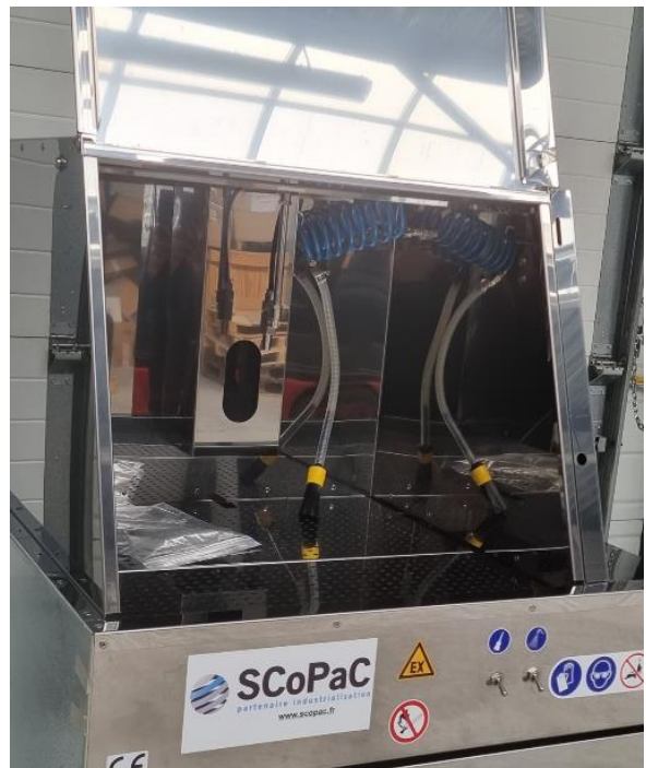
Photo Matériels installés

Photo, enceinte ouverte, avec pinceau de nettoyage autoalimenté en solvant + distributeur solvant nébulisé (avec air) pour rinçage final.